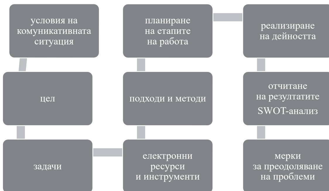
Фигура 2. Стратегията за формиране на умения за действия с текст чрез виртуална образователна среда

действия с текст чрез виртуална образователна среда; отчитане на резултатите от дейността – SWOT – анализ; предприемане на мерки за преодоляване на някои проблеми.