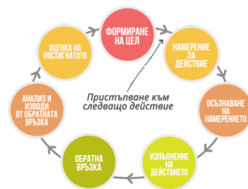
Фигура 1. Цикъл на действие на Norman

еднотипни приложения. В нашия случай това са интерактивните инструменти. Всички дейности, свързани със създаването на обобщения модел се изпълняват в своеобразен цикъл. В общия случай, ако една дейност бива прескочена, то има опасност останалите да „пострадат“ и самият модел да загуби ефективността си. В областта на разработката на интерактивните софтуерни приложения, е допустимо в определени случаи пропускането на някоя стъпка. Един потребител може ръчно да подобри представения модел въз основа на извлечените поуки в проект, дори и без софтуерна подкрепа за обобщаване на конкретния софтуерен модел. Примери за такива „прескачания“ и „обединявания“ на определени етапи от модела могат да се видят в реализираните инструменти в Глава 3 и Глава 4 от дисертационния труд.