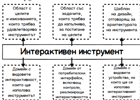
Фигура 2. Части на авторския обобщен модел на примерен интерактивен инструмент

Домейн с видовете устройства, на които ще работи интерактивният инструмент.